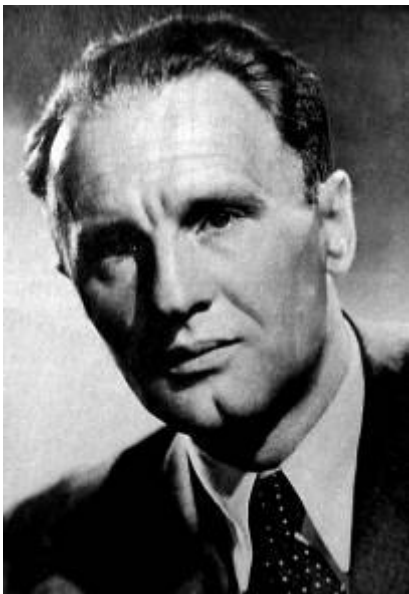
9. ábra A forradalmat eláruló Kádár János