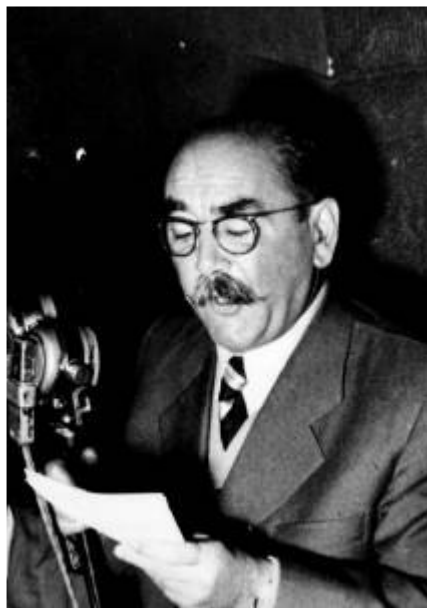
10. ábra Nagy Imre beszédet mond a rádióban