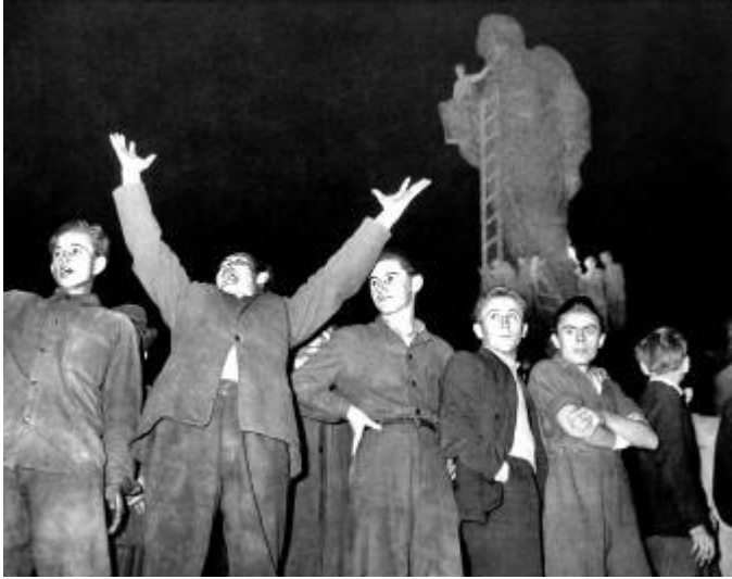
4. ábra A Sztálin-szobor ledöntésére összegyűlt fiatalok a Felvonulási-téren