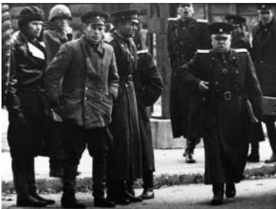
6. ábra A Budapestre bevonult szovjet katonák