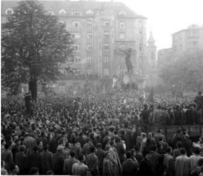
1. ábra Tüntető tömeg a Bem-téren