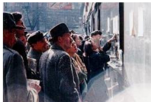
7. ábra Röplapokat olvasók