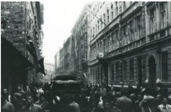
3. ábra Tüntető tömege Magyar Rádió épületénél