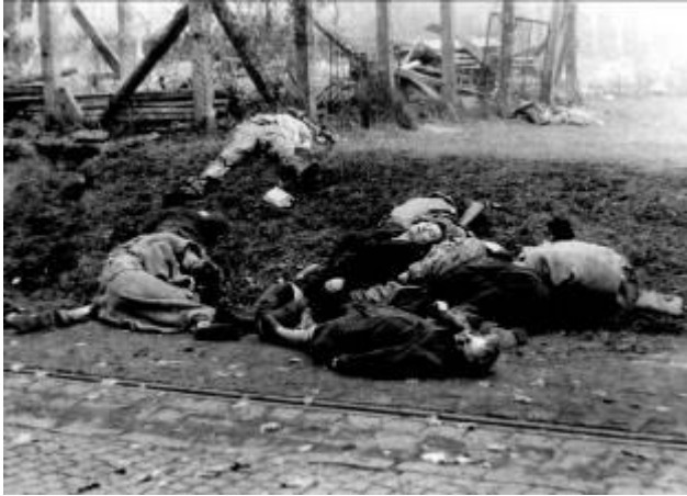
8. ábra A Köztársaság-téri vérengzés áldozatai