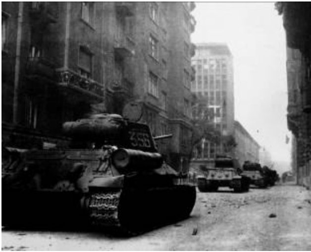
5. ábra Tankok a pesti utcán